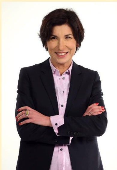
Зейналова Ирада Автандиловна

Чрезвычайный и Полномочный Посол Российской Федерации в Республике Маврикий