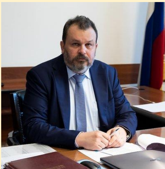
И.о. ректора Дипломатической академии МИД России, кандидат юридических наук