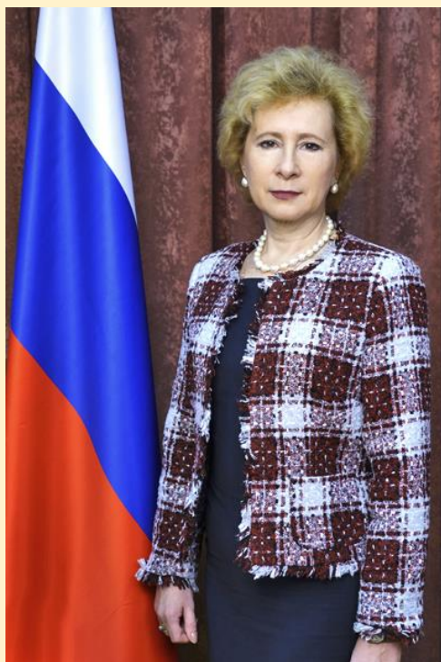
Воробьева Людмила Георгиевна Чрезвычайный и Полномочный Посол Российской Федерации в Индонезии