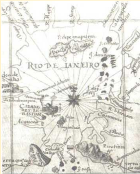
Старинная карта бухты Рио-де-Жанейро

Вообще городу Рио-де-Жанейро принадлежит особая роль в истории российско-бразильских отношений. Во многом это обусловлено тем, что Рио без малого два столетия являлся столицей Бразилии (1763 – 1960 гг.). Но даже после переноса в 1960 году столицы в г. Бразилиа, этот город и по сей день по праву считается главным