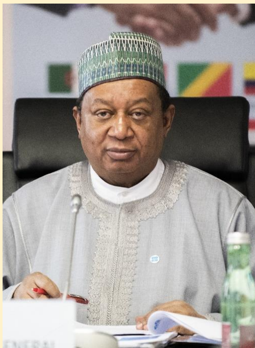
Мохаммед Сануси Баркиндо Генеральный секретарь ОПЕК