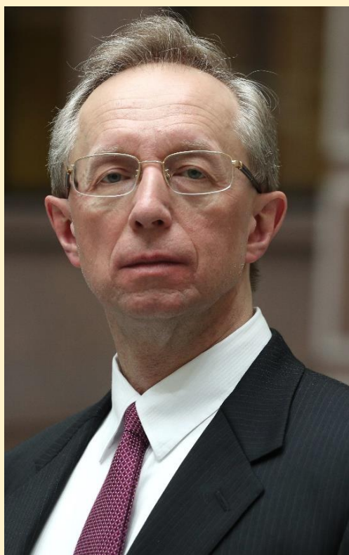
Галузин Михаил Юрьевич Чрезвычайный и Полномочный Посол Российской Федерации в Японии