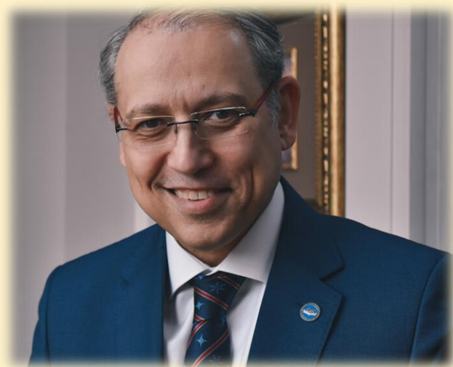
Назих Али Бахаэльдин Эльнаггари

Чрезвычайный и Полномочный Посол Арабской Республики Египет в Российской Федерации