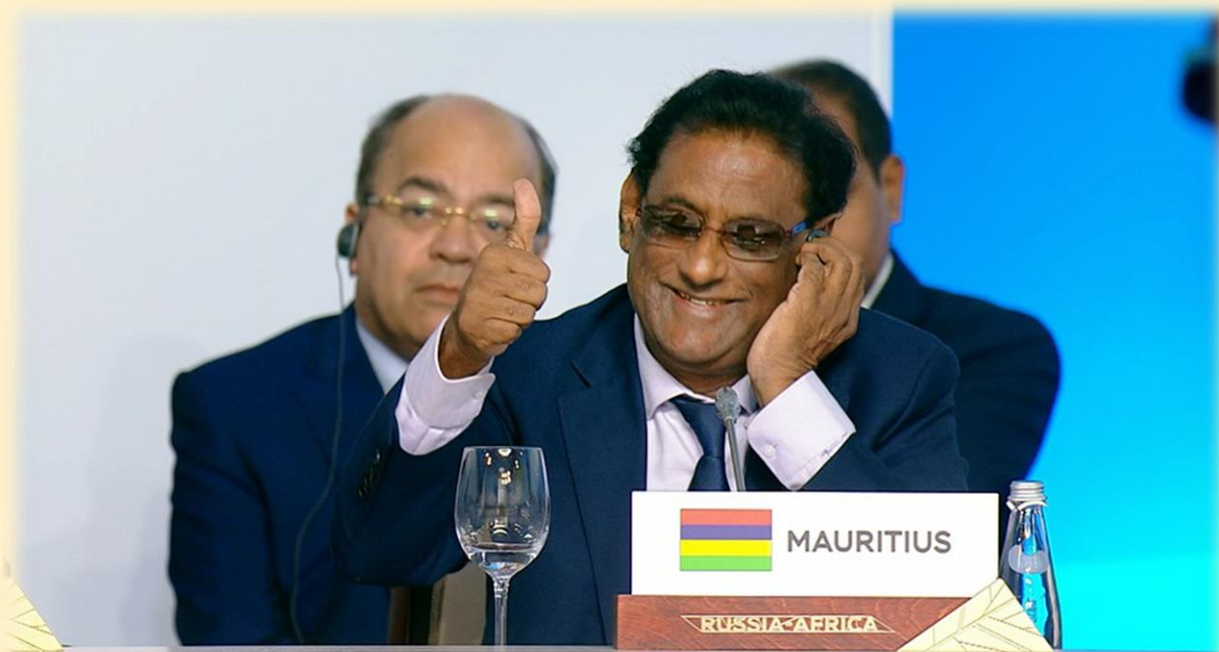
И.о. Президента Маврикия П.Ваяпури на саммите «Россия – Африка» (2019 г.)

беседа с Президентом Российской Федерации В.В.Путиным, представителями различных российских министерств и ведомств.