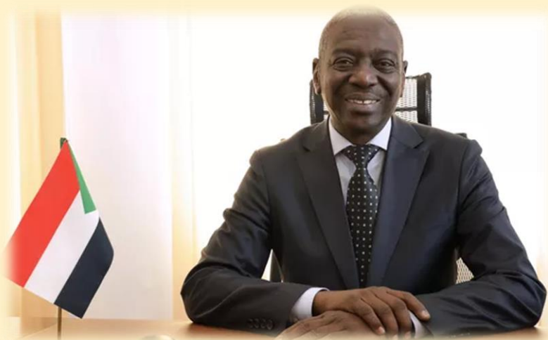
Мохаммед Эльгазали Эльтижани Сиррадж

Чрезвычайный и Полномочный Посол Республики Судан в Российской Федерации