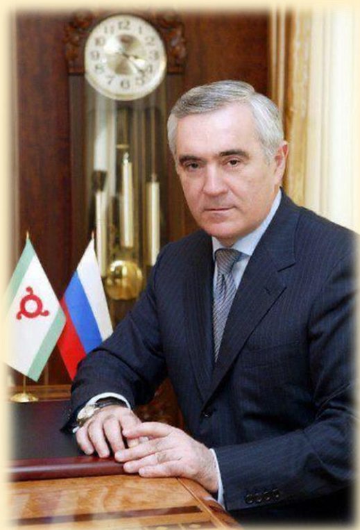
Зязиков Мурат Магометович

Чрезвычайный и Полномочный Посол Российской Федерации в Республике Кипр