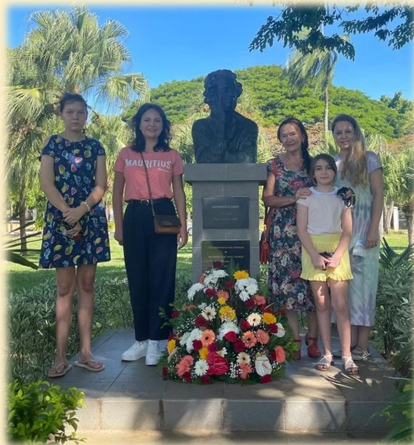
Памятник А.С.Пушкину в парке Les Salines, Порт-Луи

По инициативе Посольства в 2019 году в городском парке Les Salines был установлен бюст А.С.Пушкина, представляющий собой точную копию с оригинала работы известного советского скульптора М.К.Аникушина. В этом месте теперь мы отмечаем День русского языка.