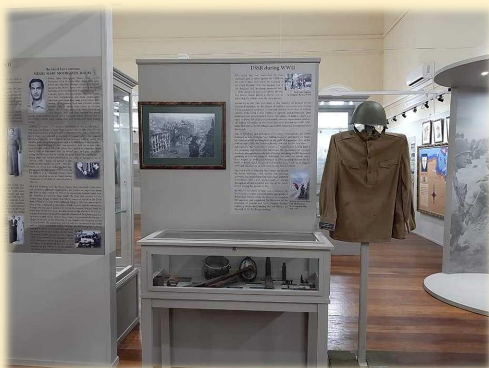
Стенд с российскими экспонатами в музее естественной истории, Порт-Луи

В 2021 году в столичном музее естественной истории в присутствии Премьер-министра Маврикия П.Джагнота состоялось открытие Галереи, посвященной истории Первой и Второй мировых войн, где был создан стенд с российскими экспонатами, переданными в дар Центральным музеем Великой Отечественной войны г. Москвы, и информацией о решающем вкладе СССР в победу над нацизмом.