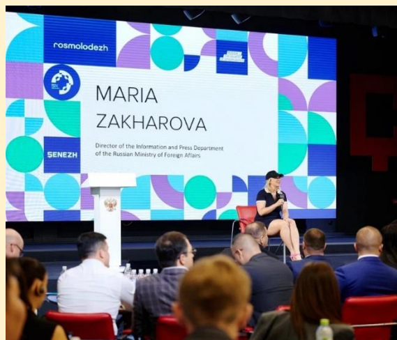
Летняя школа для государственных управленцев в Мастерской управления «Сенеж»