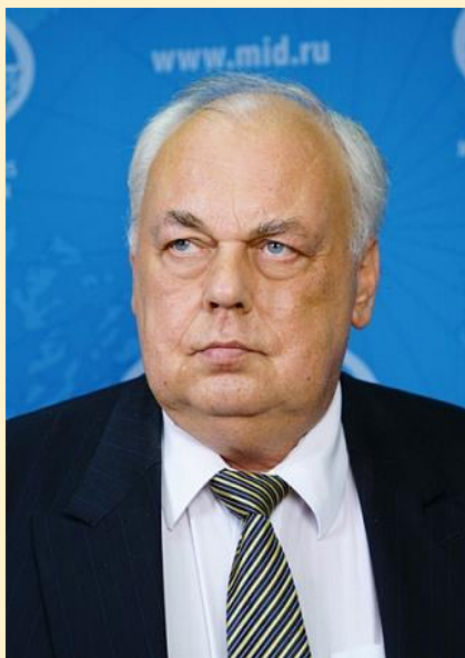
Романченко Игорь Владимирович

Чрезвычайный и Полномочный Посол Российской Федерации в Республике Перу