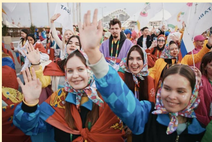
Всемирный фестиваль молодежи 2024

Значимость результатов Всемирного фестиваля молодежи, необходимость сохранения и дальнейшего развития его наследия, институционализация работы по развитию международного молодежного сотрудничества были закреплены на самом высшем уровне – поручениями Президента Российской Федерации.