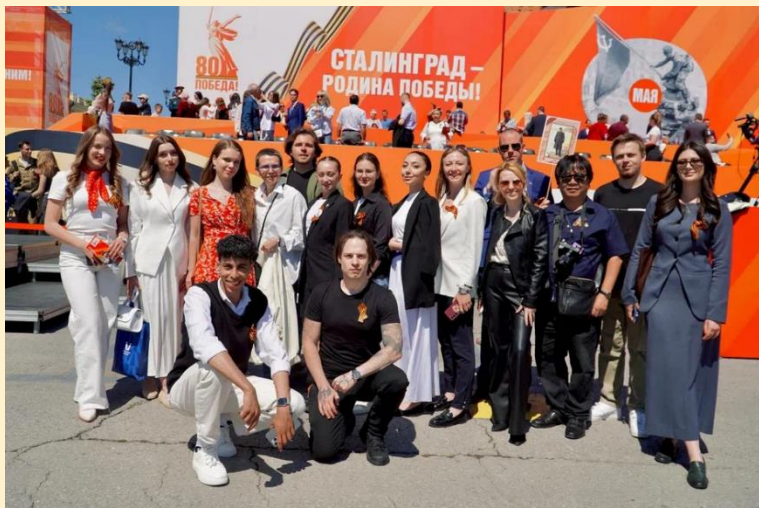
Тематический блог-тур для иностранных блогеров, посвященный 80-летию Победы в Великой Отечественной войне

Особое значение в работе с будущими элитами имеют целевые образовательные программы и стажировки. В 2025 году Дирекция впервые организовала Летние школы на базе круглогодичных молодежных образовательных центров: для дизайнеров и музыкантов в академии творческих индустрий «Меганом» на базе арт-кластера «Таврида», для преподавателей истории и русского языка как иностранного на базе Центра знаний «Машук», для медиаспециалистов в круглогодичном молодежном образовательном центре «ШУМ» и в Мастерской управления «Сенеж» для государственных управленцев. Участниками этих программ стали более 300 человек. Инициативы служили не только развитию профессиональных компетенций зарубежной молодежи, но и формированию единых ценностных ориентиров. В рамках школы для госслужащих были представлены успешные модели управления, предлагающие альтернативу западным подходам.