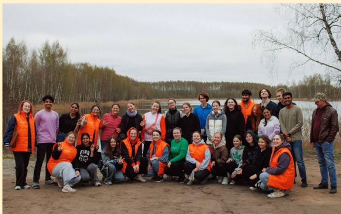
Участники Международных клубов дружбы поддержали акцию «Мы за чистоту»

по облагораживанию мемориалов и памятников, приуроченной к 80-летию Победы в Великой Отечественной войне.