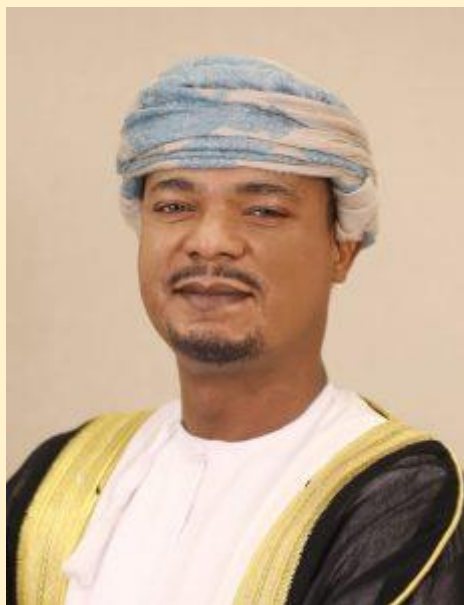
Хамуд Бен Салим Аль Тувайх

Чрезвычайный и Полномочный Посол Султаната Оман в Российской Федерации