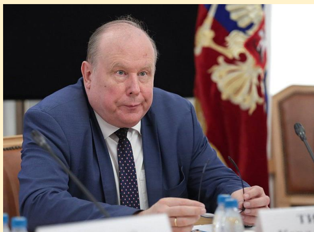
Тихазе Карл Карлович

Чрезвычайный и Полномочный Посол Российской Федерации в Демократической Республике Конго