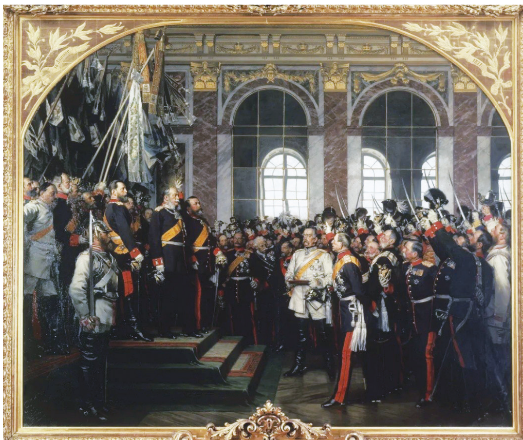
«Провозглашение Германской империи». Картина А. фон Вернера

сов сначала между Парижем и Веной, а с конца XVII в. к ним присоединился Лондон.