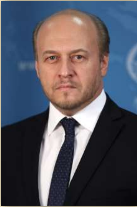
Томихин Евгений Юрьевич Чрезвычайный и Полномочный Посол Российской Федерации в Королевстве Таиланд