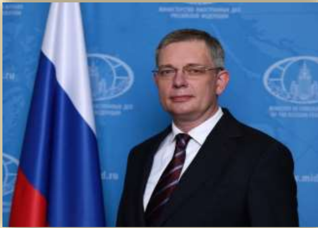
Алипов Денис Евгеньевич Чрезвычайный и Полномочный Посол Российской Федерации в Республике Индии