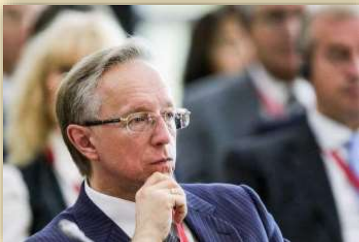
Галузин Михаил Юрьевич Чрезвычайный и Полномочный Посол Российской Федерации в Японии