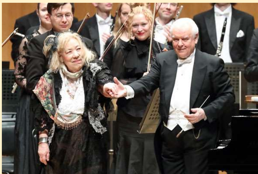
Дирижер Симфонического оркестра Московской филармонии Ю. Симонов

К настоящему времени мероприятия в рамках Фестиваля состоялись во всех 47 префектурах Японии, их посетили более 18 миллионов человек, а перед японской аудиторией выступили более 11 тысяч российских артистов. Это наглядное свидетельство глубочайшего интереса японцев к российскому искусству, стремления японского народа строить дружественные отношения с нашей страной.