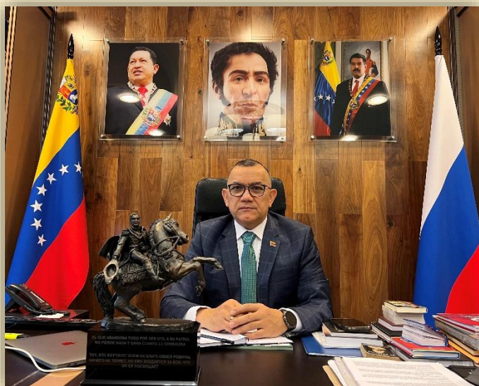
Хесус Рафаэль Саласар Веласкес

Чрезвычайный и Полномочный Посол Боливарианской Республики Венесуэла в Российской Федерации