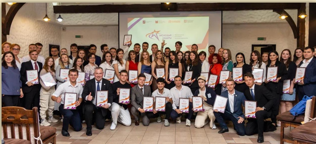
Школа «Молодые лидеры», 7-11 июля 2023 г., Беларусь

Серия молодежных образовательных мероприятий началась со школы «Молодые лидеры», два года она проходила в Болгарии. В этом году молодые лидеры собрались 7–11 июля в Беларуси.