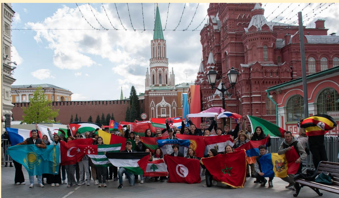
Форум победителей конкурса «Великий Сталинград: наша история, наша память», май 2023 г., Москва

Форум победителей конкурса «Великий Сталинград: наша история, наша память» собрал 30 молодых соотечественников в возрасте от 14 до 17 лет из 30 стран СНГ, Европы, Азии, Африки и Ближнего Востока. Ребята провели неделю в Москве и Волгограде, участвовали в серии образовательных и исторических мастер-классов, квестов и квизов, посетили памятные места, посвященные событиям Великой Отечественной войны.