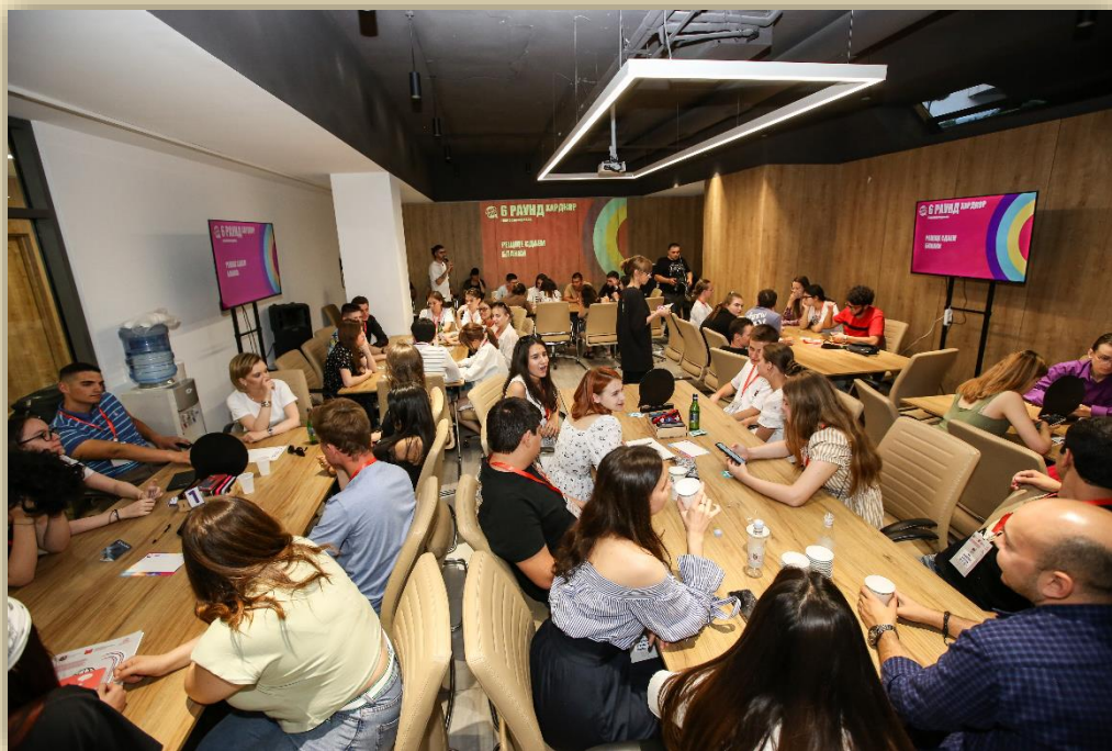
Медиашкола для молодых соотечественников, июнь 2023 г., Ереван, Армения

В Москве в прошлом году для молодежи был запущен «Проектный акселератор». Проектному управлению учились команды из Абхазии, Азербайджана, Армении, Беларуси, Донецкой Народной Республики, Казахстана, Киргизии, ЛНР и Узбекистана. Такое же мероприятие состоялось и в минувшем августе. Из 37 команд жюри выбрало трех победителей, их проекты получают поддержку в реализации в 2024 году.