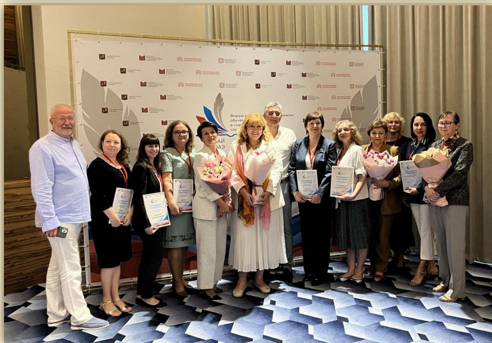
Форум русских школ за рубежом, Дубай, июнь 2023 г.

Катара, Омана, Ливана, Египта, Иордании, Марокко, Сирии, Туниса, Алжира.