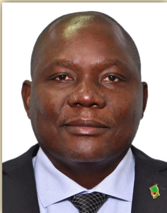
Шедрек Чингембу Лувита

Чрезвычайный и Полномочный Посол Республики Замбия в Российской Федерации