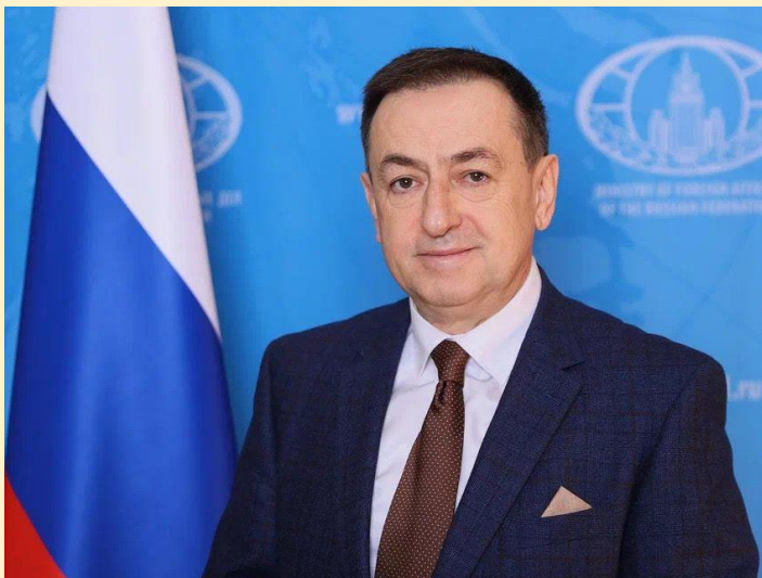
Аветисян Андрей Левонович

Чрезвычайный и Полномочный Посол Российской Федерации в Объединенной Республике Танзании