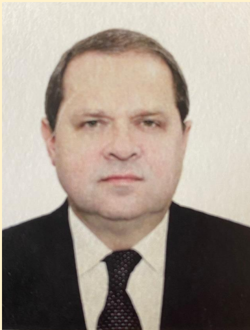
Новиков Алексей Алексеевич

Чрезвычайный и Полномочный Посол Российской Федерации в Непале