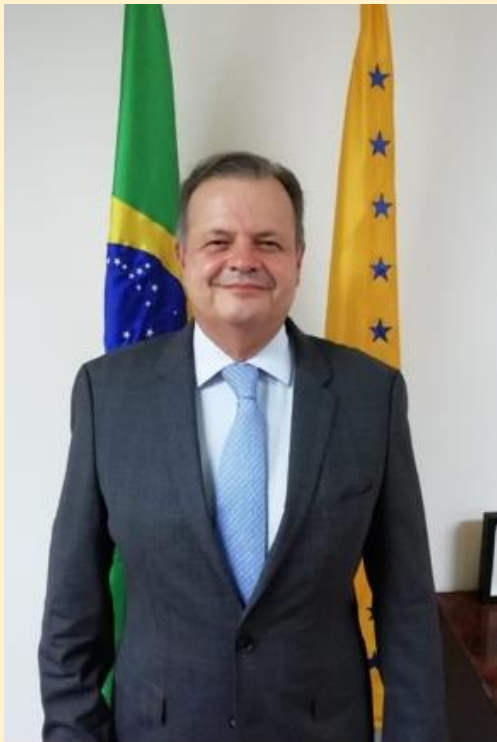
Родриго де Лима Баэна Соарес

Чрезвычайный и Полномочный Посол Федеративной Республики Бразилии в Российской Федерации