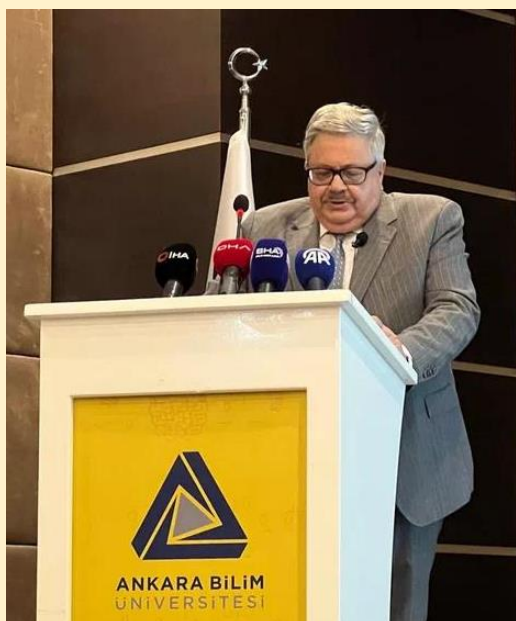
Ерхов Алексей Владимирович

Чрезвычайный и Полномочный Посол Российской Федерации в Турецкой Республике