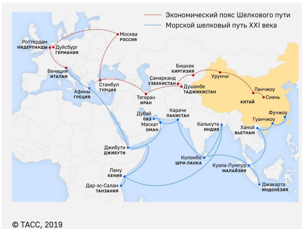
Рисунок 2 – Направления развития инициативы «Один пояс, один путь»

– морские: через Южно-Китайское море и Малаккский пролив до Индийского океана и дальше до Европы; из китайских портов через Южно-Китайское море – в южную акваторию Тихого океана.