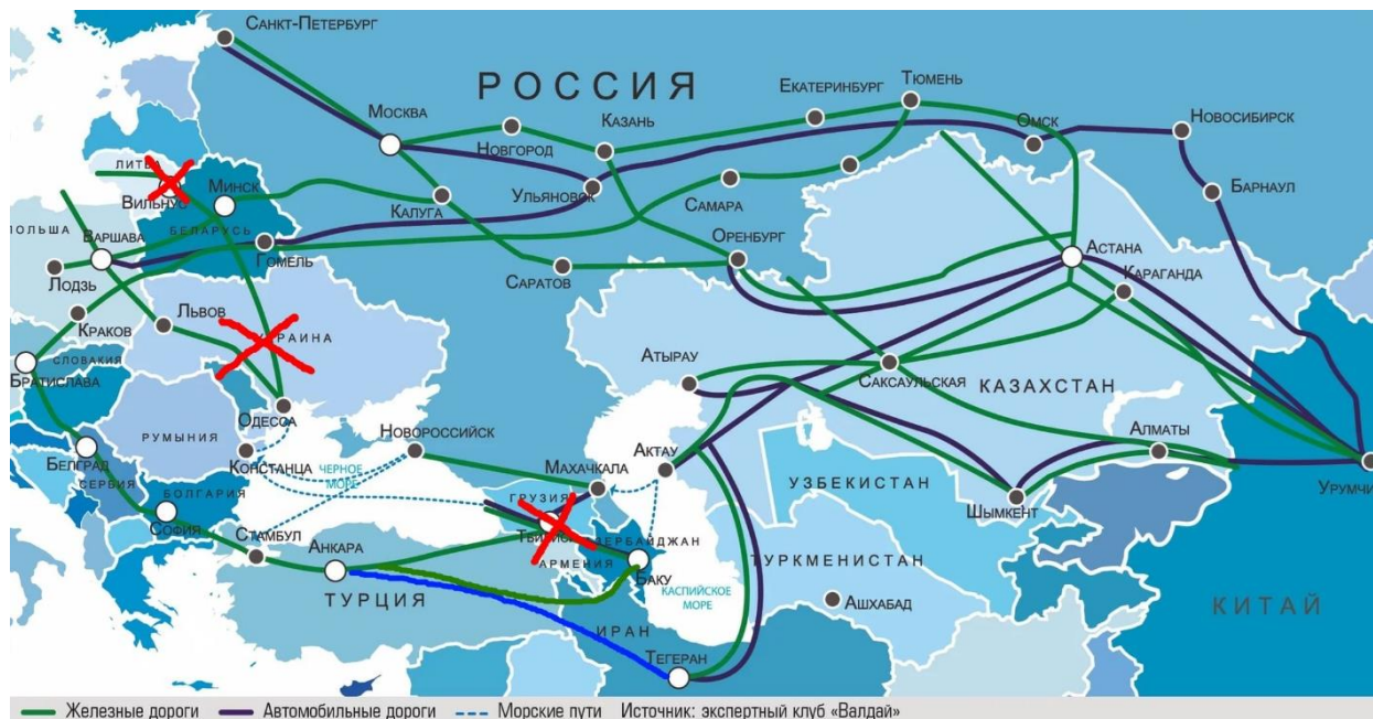
Рисунок 3 – Основные перспективные направления Экономического пояса Шёлкового пути

Столетиями Центральная Азия обладает важным геополитическим положением, объединяющим страны региона в контексте регионального и международного взаимодействия, в том числе по историческому маршруту Шёлкового пути.