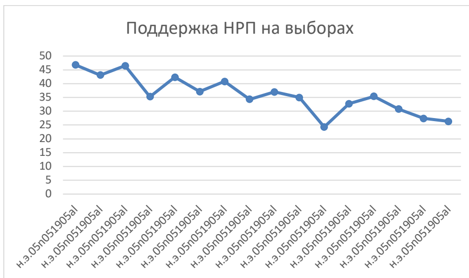
Таблица 1. Уровень поддержки населением Норвежской рабочей партии 1961–2021 гг. График составлен по данным сайта Poll of polls // Pollofpolls.no. Available at: http://www.pollofpolls.no/?cmd=Stortinget (Accessed: 09.02.2022).

позволяло ей практически в одиночку формировать правительство и принимать решения в парламенте. График также показывает, что на протяжении длительного временного промежутка (60 лет) партия имела стабильно высокие результаты на выборах, получая около трети или даже больше голосов избирателей. В сентябре 2021 г., после восьми лет правления правой коалиции, НРП вновь одержала победу, получив 26,3% голосов.