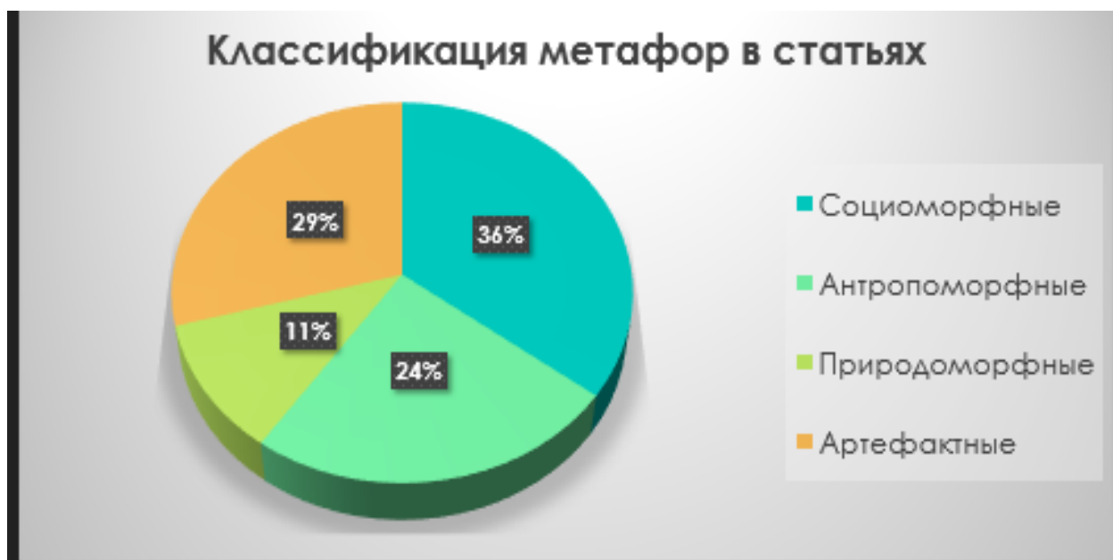
Рис.1. Количество метафорических высказываний и их процентное соотношение (составлено авторами)

Общий анализ всего имеющегося текстового материала трех статей показал следующие результаты, которые представлены в графическом виде (рис. 1).