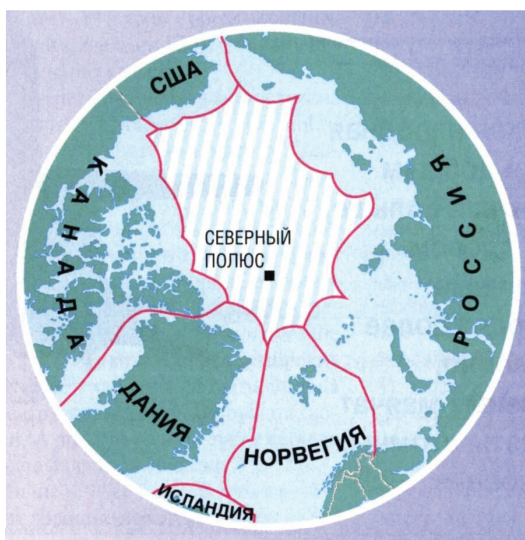
Страны «арктической пятёрки»

Этот вывод подтверждается реальной политикой Соединенных Штатов Америки в Арктике, которые давно не скрывают свой интерес к освоению этого региона. Главные его причины связаны с экономикой, а именно с полезными ископаемыми и грузоперевозками. Прямым следствием этого является повышенное внимание США к региону с точки зрения национальной безопасности и усиления группировки собственных вооружённых сил. С учётом данного обстоятельства Пентагон регулярно изучает актуальную ситуацию в регионе и предлагает различные варианты реагирования на неё. В этой связи за последние пять лет были разработаны три варианта Арктической стратегии США: в 2019-м, 2021-м и 2024-м гг., каждая из которых учитывала текущую международную ситуацию.