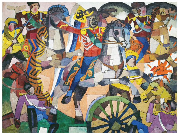
Гвардия не сдается. Аристарх Лентулов. Победный бой (военное панно). 1914. Частное собрание