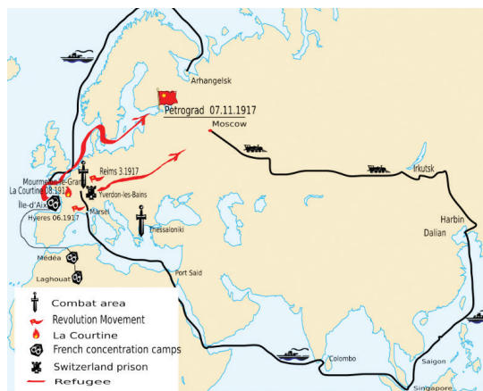
Маршруты движения пехотных бригад Экспедиционного корпуса Русской армии

Пример русских бригад во Франции показал нашему герою нежелание русских солдат воевать на фронтах Первой мировой войны. Из прошлого вспомнился и солдат с двумя вздытыми на штык караваями, со спокойной совестью решивший после Мукдена отправиться по шпалам к себе домой, в Тамбовскую губернию, и солдатское